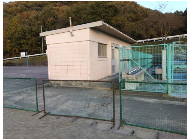
プール横のトイレ