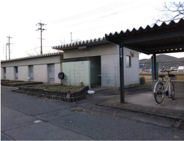
駐輪場横の屋外トイレ

藍川中学校には屋外トイレが駐輪場の横にあります。老朽化しメンテナンスもされていないため、現在使用には適していない状況です。一方、プール横にもトイレはあるものの、普段は施錠されており、いつでも使用できる状況ではありません。土日祝日の屋外の部活動の生徒たちは困っていますとの声をPTA本部に頂き、改善の願いを学校側へ相談しています。学校としても岐阜市へ屋外トイレ改修の打診の努力はしているものの、時間がかかると思われます。対策として部活動の際に施錠されているプール横のトイレを使用できるように調整をいただいています。生徒たちが部活動に集中できる環境づくりをPTA本部としても学校と協力していきます。