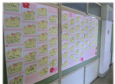
【3年生廊下掲示：新年の抱負】

藍東生一人一人が、今年1年間の自分の足跡をしっかり振り返り、次の学年に向けて、「 どんな自分(たち)でいたいのか 」「 どんな自分(たち)になりたいのか 」を、しっかり思い描く2月にしてください。