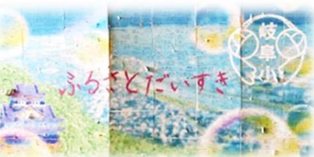
～『みんなで創り上げたミッション』 R5 ふるさとふれあいフェスタより～

新1年生の47名を迎え、全校児童275名、全15学級と職員33名で、保護者と地域の皆様の支えのもと、令和6年度がスタートしました。教育目標『心豊かで自ら求め 学び合う 岐阜小の子ども』、合い言葉『ふるさと大好き』に向かって、新たな「いっぽ (一歩)」を踏み出していきます。