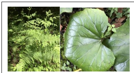
植物を観察してみよう