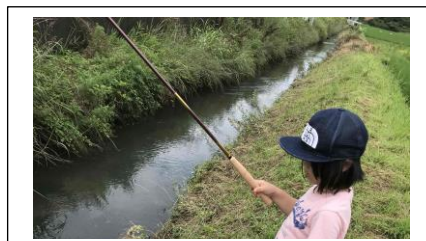
釣りをしてみよう