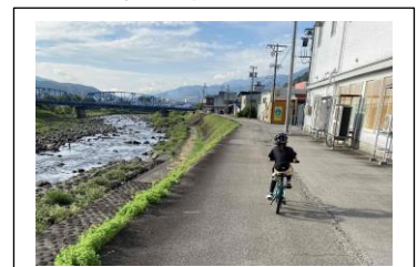
大人とサイクリングしよう