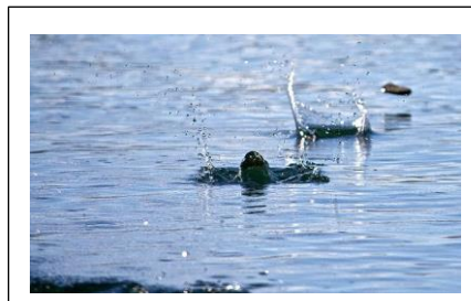
みずきりをしよう