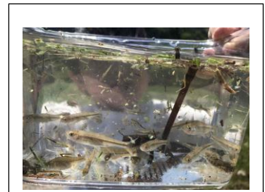
生き物を観察してみよう