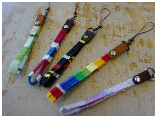
手織りキーホルダー