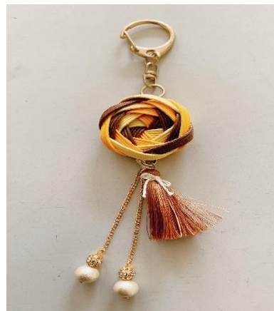
花編みタッセルの キーホルダー