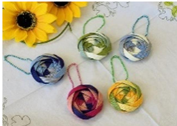
花編みキーホルダー