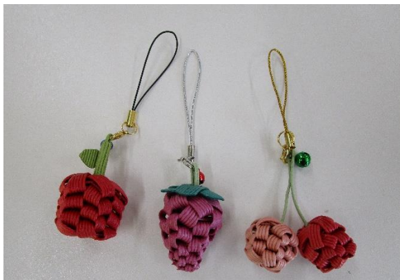
フルーツチャーム