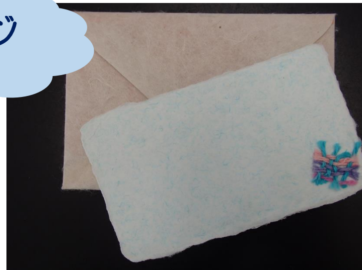
メッセージ カード