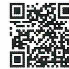
あんしんフィルター for docomo