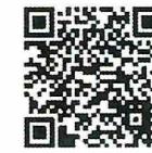
あんしんフィルター for SoftBank