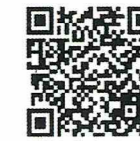
あんしんフィルター for au