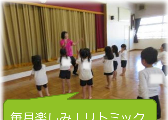
毎月楽しみ！リトミック