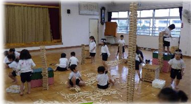
みんなで高く積み上げよう！