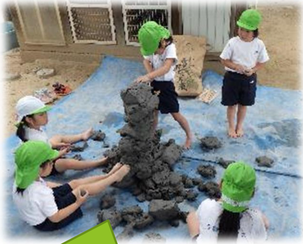
みんなでペタペタ泥粘土