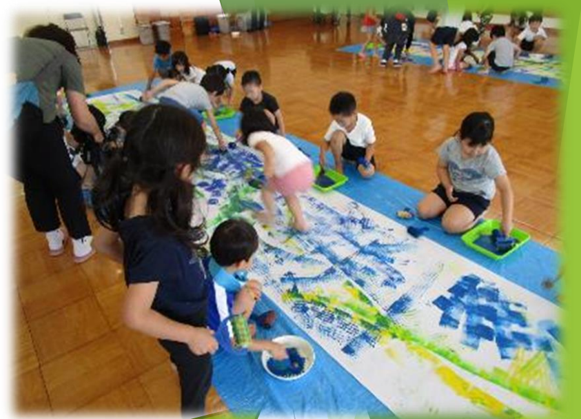
ローラーで絵の具遊び！