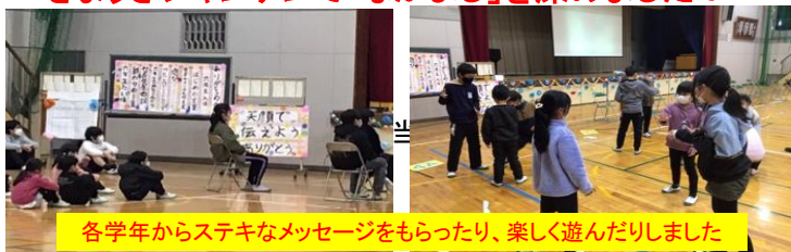
各学年からステキなメッセージをもらったり、楽しく遊んだりしました