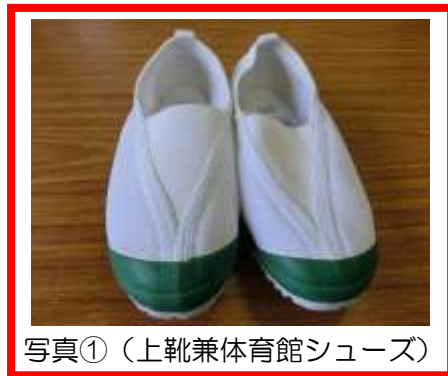
写真①（上靴兼体育館シューズ）

*上靴と体育館シューズを兼ねて 緑色の縁取りのあるシューズ（写真①） を使用します。