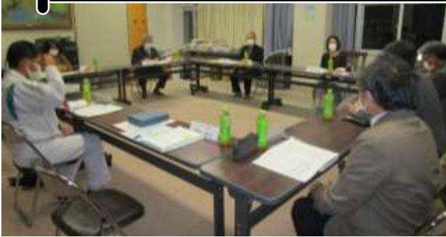
▲第2回学校運営協議会（11月26日）

11月26日（木）、さわやかルームにおいて、今年度2回目の学校運営協議会を開催しました。今回のテーマは、木田小におけるいじめ防止に対する取組や活動について方針や現状をお話し、委員の方からご意見や指導・評価をいただくことです。