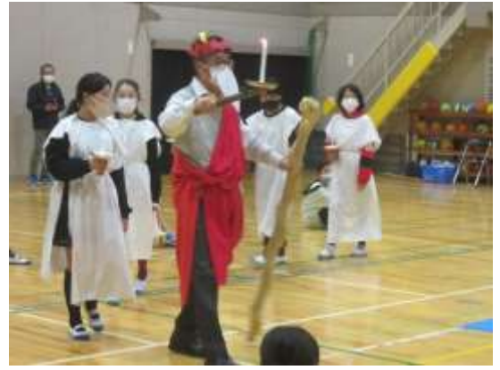
▲成長を誓う会（誓いのキャンドルサービス）

その後、ゲームやダンスを披露し、大いに盛り上がりました。自分たちで創り上げた姿に、逞しさを感じました。