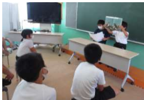
写真：図書委員会の子による読み聞かせ（大好評企画・6月25日）