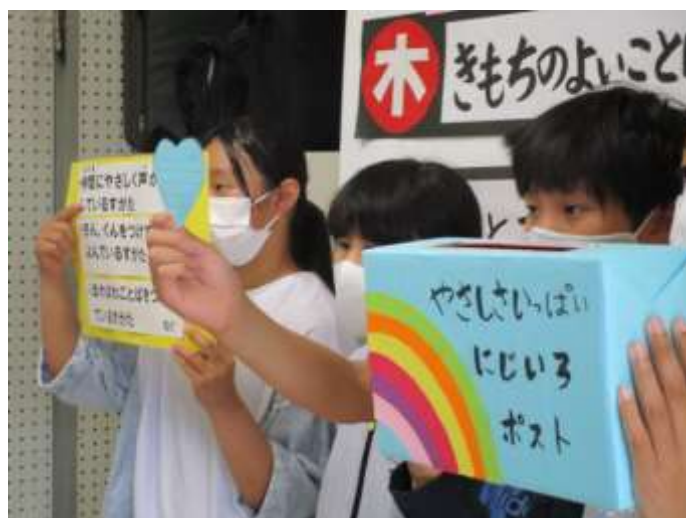
写真左：児童会のお話を聞く子どもたち 写真右：「やさしいっぱいの虹」取組について話す児童会（7月2日・全校集会）