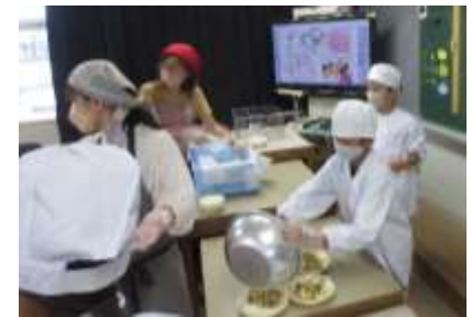
▲写真:給食時間のようす(7月12日)