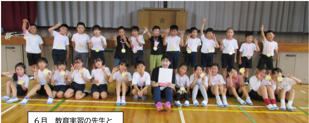
6月 教育実習の先生と

保護者の皆様にはこの1年、いつも温かく見守っていただき、本当にありがとうございました。