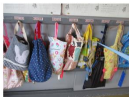
体育館シューズ と シューズ入れ(袋)