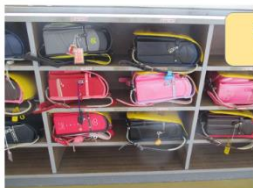
通学用かばん (ランドセル)