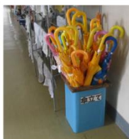
傘 通学用・置き傘用