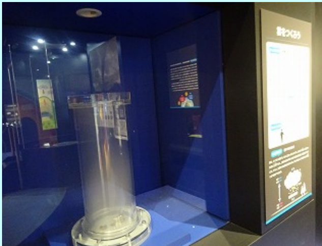
容器の中に空と同じ環境をつくってみよう。