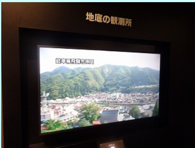
10分20秒の映像でスーパーカミオカンデを紹介するよ。