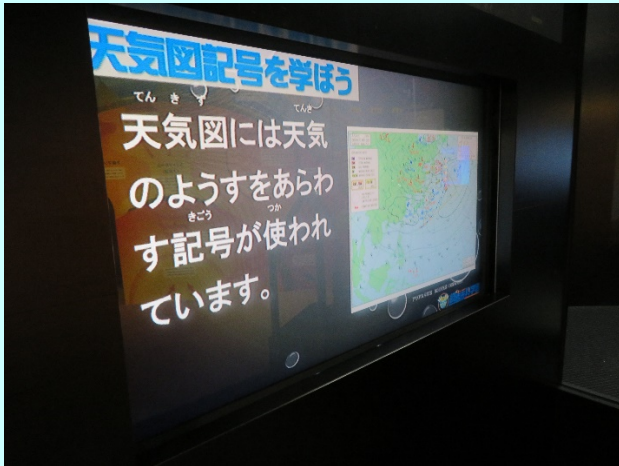
天気の様子を表す天気図記号について解説しているよ。