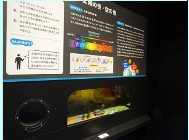
太陽の白い光が水そうを通ると色が変わるよ。