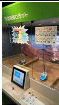
最近じわりと人気の展示物紹介コーナー 「惑星探査ロボット」

最近になってじわりと人気が出てきているのが、操縦レバーの取り合っている方向によって操縦レバーの操作が前後左右逆になり、なかなか速く鉱石をゲットできません。コツは、自分が探査ロボットに乗り込んでいる気になってレバーの操作を行うことです。残り時間80秒はなかなか出ません。せひ80秒以上を残して特級を勝ち取って下さいね。