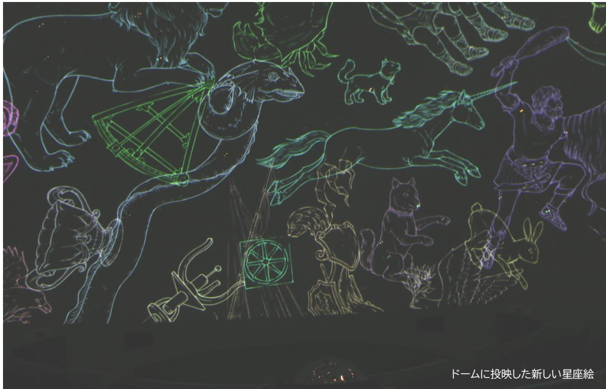
ドームに投映した新しい星座絵