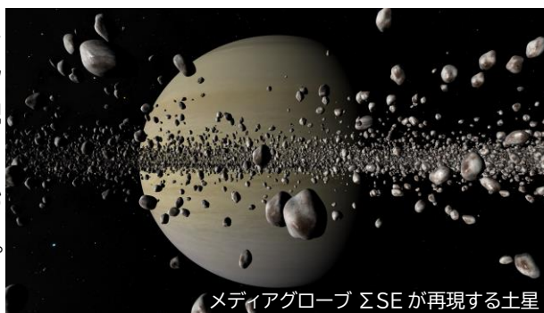
メディアグローブ ΣSE が再現する土星

令和6年12月17日(火)から休演していたプラネタリウムが、いよいよ令和7年3月15日(土)に再開するよ! 休演の3か月の間に、岐阜市科学館プラネタリウムに新たな仲間「デジタル式プラネタリウム『メディアグローブΣSE』」が加わったよ。デジタル式プラネタリウムを使うと宇宙から見る星空を再現でき、月や惑星など太陽系の天体に近づいたり、宇宙の果てまで移動をするなど、宇宙旅行もできるようになったんだ。地上から見る星空も素敵だけど、間近で見る惑星の姿は圧巻で、みんなに宇宙のことをより分かりやすく説明できるようになったんだ。僕のおすすめは土星の環。土星の環はたくさんの氷や岩石の粒できているんだけど、その姿も再現してくれるんだ。みんなも環の中をくぐってみよう! またみんなに満天の星の下、いろんな星座や宇宙のお話ができるのを、ぼくはとっても楽しみにしているよ。パワーアップしたプラネタリウムで待ってるね!