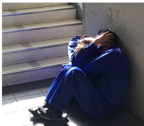
階段下で頭を守りながら真剣に訓練に臨む生徒

生徒達は、まわりの生徒に声を掛けながら、 誰1人取り残されることなく、無事に避難することができました 。避難にかかった時間は、予告して実施する訓練よりも2倍近く（約8分）かかりましたが、生徒にとっても教職員にとっても実践的なよい訓練となりました。