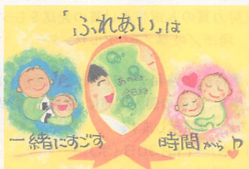
第11回(令和3年度)中学生以上の部 最優秀作品

みなさんの声を聞かせてください “エールぎふ”総合相談 0120-43-7830