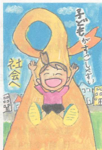
第11回(令和3年度) 小学生以下の部 優秀作品