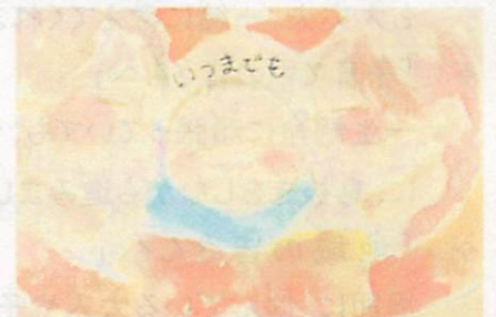
第11回(令和3年度)中学生以上の部 優秀作品

2004年、栃木県小山市で3歳と4歳の兄弟が父親の友人から再三にわたって暴行を受け、橋の上から川に投げ込まれて命を奪われるという痛ましい事件をきっかけに、全国でオレンジリボン運動が始まりました。オレンジリボンは、子ども虐待をなくす運動の象徴です。