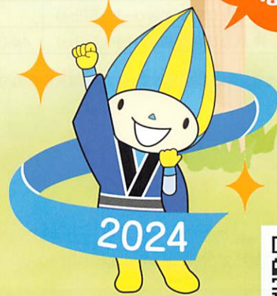
大会マスコットキャラクター ミナモ

第39回国民文化祭と第24回全国障害者芸術・文化祭の統一名称で、各種の文化活動を全国規模で発表・共演・交流する祭典です。 [キャッチフレーズ]とともに・つなぐ・みらいへ ~清流文化の創造~