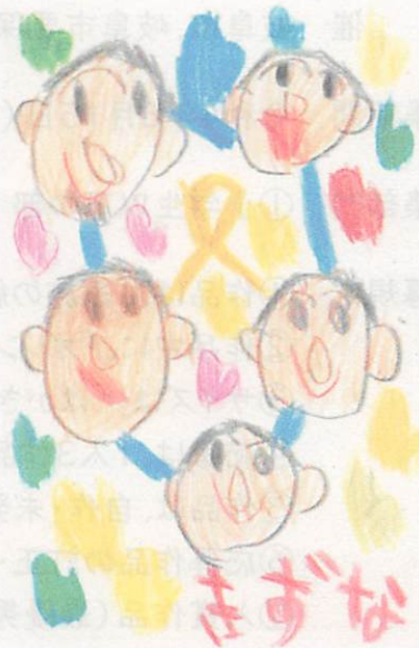
第11回(令和3年度) 小学生以下の部 最優秀作品

岐阜市では、子ども虐待防止のシンボルである「オレンジリボン」をあしらった「絵てがみ」を募集しています。「家族の絆」や「親子のふれあい」をテーマに心温まる作品をぜひ、ご応募ください。