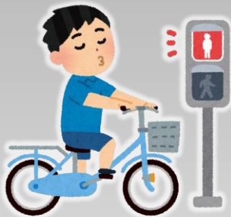
しんごう むし 信号無視などの違反