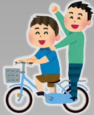
ふたりの 二人乗り