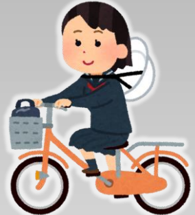
ヘルメットをきちんとかぶって いない