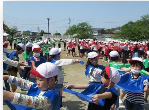
▲写真：全校児童が「校章」を描く

前日には、運動場に大きな「校章」の線が引かれました。子どもたちは、赤色、青色、緑色のシートを被り、この「校章」の線に沿って立ちました。セスナ機が近づくと、そのシートを肩の高さまで上げ、校章の形を描くことができました。