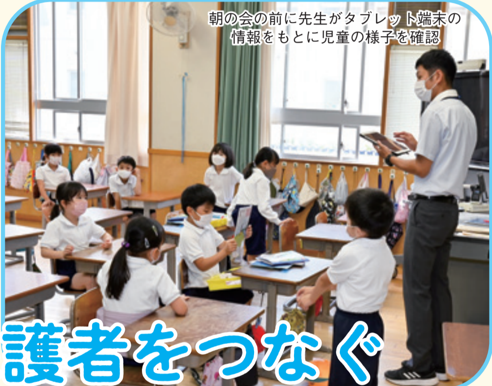
朝の会の前に先生がタブレット端末の 情報をもとに児童の様子を確認