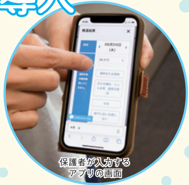
保護者が入力する アプリの画面

市立小・中学校、特別支援学校、幼稚園では、学校と保護者間の欠席連絡や検温報告、お便りの配布がスマートフォンでできる「スマート連絡帳」を6月から導入しました。これまで電話や紙で行われてきた学校と保護者間の連絡をデジタル化し、保護者の利便性向上と学校の朝の繁忙など負担軽減を図る取り組みです。教育現場におけるデジタル化が進んでいます。☎ 学校指導課GIGAスクール推進室☎214-2193【関連記事】4面に掲載