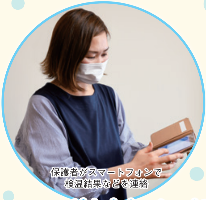
保護者がスマートフォンで 検温結果などを連絡